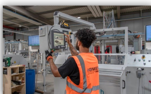
Terminaux de Forsis

Pour le déroulement sans papier des processus logistiques, ID-Systems AG a évalué et livré des imprimantes d'étiquettes, des lecteurs de code-barres, des terminaux mobiles et fixes ainsi que des chariots mobiles.