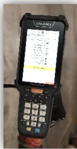
Skorpio X5 de Datalogic