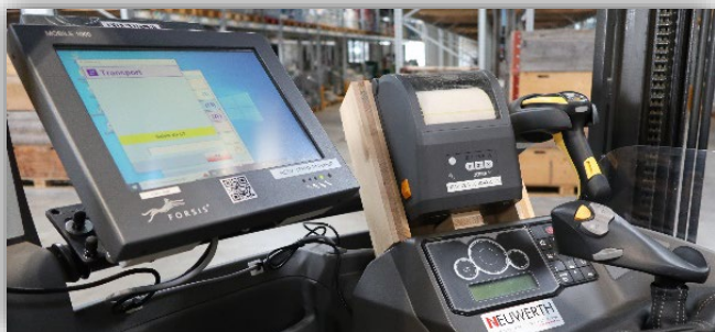
Terminal de Forsis, imprimante de Zebra & Powerscan de Datalogic