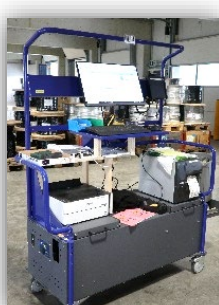
Chariot mobile de Forsis