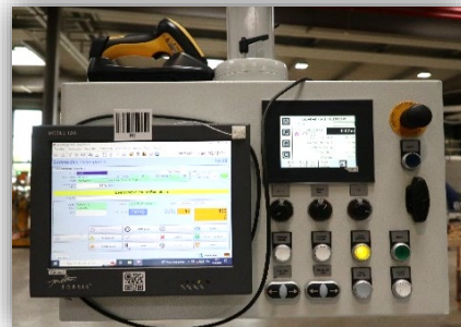
Terminal de Forsis