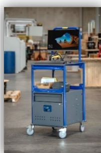
Chariot mobile de Forsis