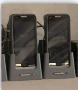
Memor 20 de Datalogic